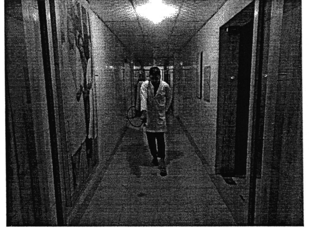
চিত্র ২: গবেষণাগার জীবানুমুক্তকরণ ও পরিষ্কার-পরিচ্ছন্ন করা